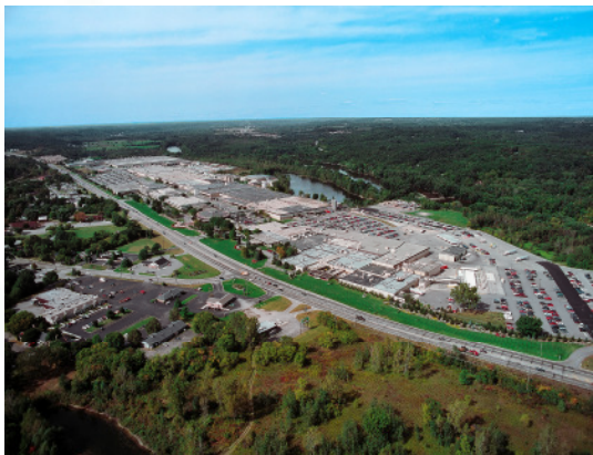
Amway, Ada, MI