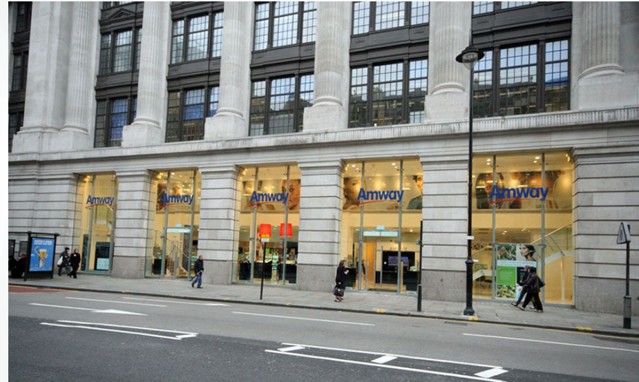
Amway Flag Ship Store, London